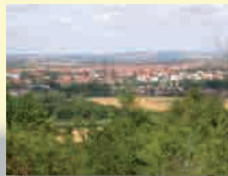
Panorama sur Riom